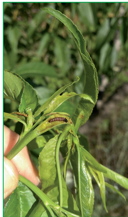
Рис. 1. Гусениця фруктової смугастої молі у пагоні персика

Після перезимівлі гусениці фруктової смугастої молі пошкоджують бруньки, потім молоді однорічні пагони (рис. 1), що призводить до їхнього всихання. Характер