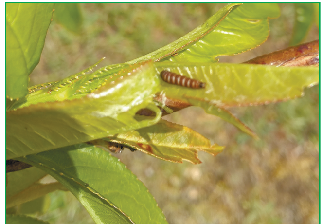
Рис. 3. Заляльковування гусениці фруктової смугастої молі