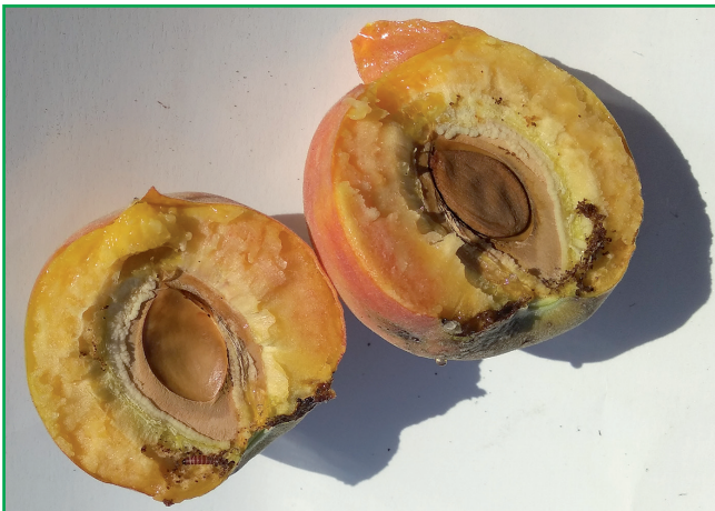
Рис. 2. Гусениця шкідника у пошкодженому плоді персика

Гусениці фруктової смугастої молі заляльковувалися з кінця квітня впродовж першої декади травня в основному у листках (41,0%) (рис. 3), тріщинах кори штабів і скелетних гілках дерев персика (45,7%), а також у рослинних рештках (13,3%). У насадженнях персика протягом 2018–2019 рр. виліт метеликів першого покоління зафіксовано в однакові строки — з кінця першої декади травня (06–07.05). Накопичення СЕТ >8°C на ці дати різнилося і становило 154,5–254,3°C (табл. 1). У 2020 р. перші особини шкідника спостерігали у пастках пізніше — з 18.05 (СЕТ >8°C 227,8°C), що пов'язано з несприятливими погодними умовами першої полови-