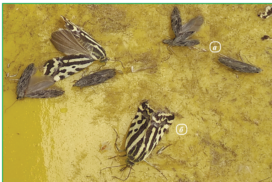
Рис. 4. Метелики: а — фруктової смугастої молі; б — березкової совки