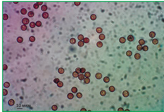
Рис. 3. Спори Physarum cinereum

6. Gubler W.D., Converse R.H. Diseases of Strawberry ( Fragaria × ananassa Duch.) . URL: http://www.apsnet.org/publications/commonnames/Pages/Strawberry.aspx