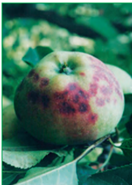
Рис. 2. Плоди яблуні, пошкоджені каліфорнійською щитівкою