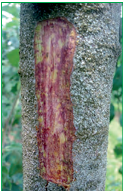
Рис. 1. Стовбур яблуні, заселений каліфорнійською щитівкою та пошкодження нею камбію

Аналіз даних, опублікованих у вітчизняній літературі [6–8], свідчить, що заходи обмеження чисельності цього об'єкта в промислових насадженнях яблуні умовно можна розділити на два строки: навесні (за середньодобової температури повітря не вище +5^{\circ}\text{C} , фаза «набрякання бруньок», (ВВСН 0,1–0,3) та в період вегетації (ВВСН 0,7–10 — ВВСН 81–89). Навесні застосовують оливи, принцип дії яких полягає в заповненні дихальних органів шкідника та в затриманні або відсутності доступу до них кисню, комахи гинуть від асфіксії (задухи). Для цього використовують препарати на основі рослинної олії (Кодасайд 950, ЕМ; Препарат 30-Д, КЕ) чи мінеральних олив (Препарат-30В, КЕ; Олемікс 84, КЕ; Селфі Ойл, КЕ). В Україні їх ще використовують в період вегетації, як прилипачі для пестицидів, зокрема й проти личинок щитівки. Згідно з чинним Переліком пестицидів і агрохімікатів, дозволених до використання в Україні, [9] в період вегетації проти фітофага використо-