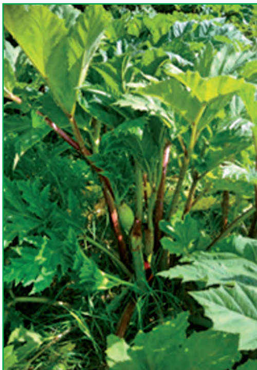
Heracleum Sosnowskyi у природних біоценозах

Застосування бакової суміші препаратів Елюміс, ОД (2 л/га) разом із Раундап Макс, РК (2,5 л/га) забезпечило найвищий і найбільш стабільний рівень контролювання борщівника Сосновського у всіх досліджуваних фазах розвитку, що вказує на синергічну дію препаратів. Статистичний аналіз підтвердив достовірність встановлених відмінностей між варіантами досліду та фазами розвитку рослин, а побудована регресійна модель з