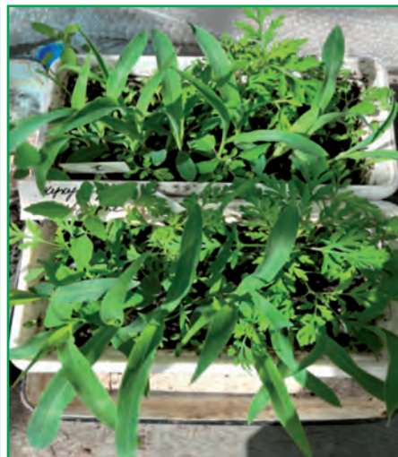
Рис. 3. Розвиток рослин кукурудзи і амброзії полинолістої у фазі двох листків