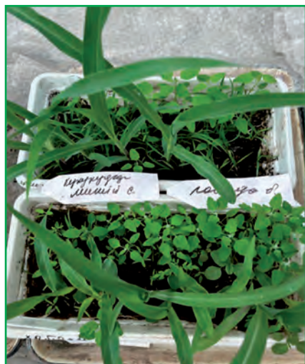
Рис. 1. Одночасний розвиток рослин мишію сизого та кукурудзи і лободи білої та кукурудзи

У польових умовах на дослідних ділянках сегетальна рослинність у посівах кукурудзи була представлена різними видами бур'янів з різних біологічних груп, а саме: амброзія полиноліста ( Ambrosia artemisiifolia L.),