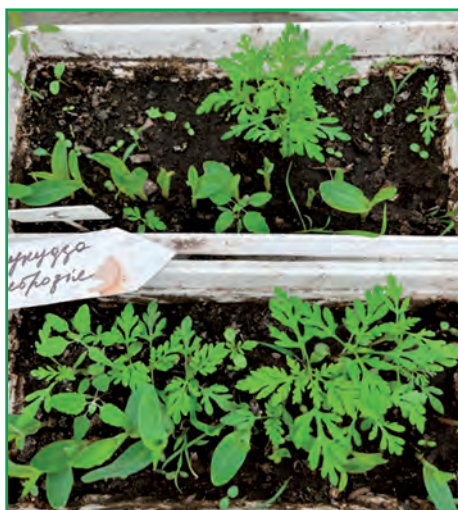
Рис. 2. Розвиток рослин амброзії полинолістої і кукурудзи у початковий період онтогенезу