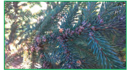
Рис. 2. Колонія несправжньощитівки на гілці ялини (оригінальне фото)