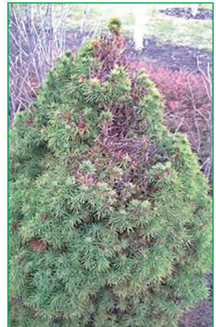
Рис. 3. Ознаки пошкодження ялиновим павутинним кліщем (оригінальне фото)