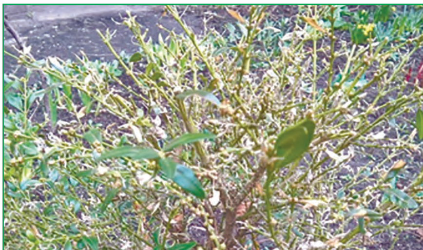
Рис. 7. Куш букеусу, об'їдений самшитовою вогнівкою (оригінальне фото)