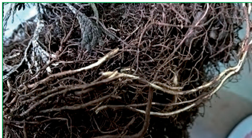
Рис. 6. Коріння туї, обгризені личинками довгоносика-скосаря (оригінальне фото)

якості харчової приманки та обов'язкове застосування хімічного захисту (обприскування дерев до початку розпускання бруньок; обприскування дерев в період виходу комах з-під кори і масового льоту жуків;