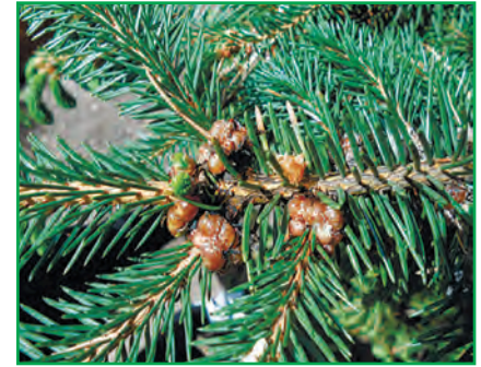
Рис. 1. Заселеність ялини несправжньощитівкою (оригінальне фото)