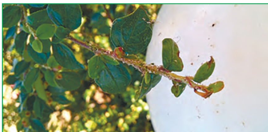
Рис. 8. Колонія попелиці на барбарисі (оригінальне фото)