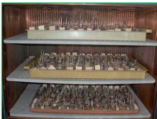
Рис. 4. Інкубація зразків картоплі з літніми зооспорами збудника раку у клімокамері