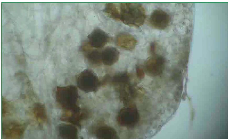
Рис. 8. Верхівка паростка сорту картоплі Поліська рожева, уражена літніми зооспорами збудника раку (8 × 15)