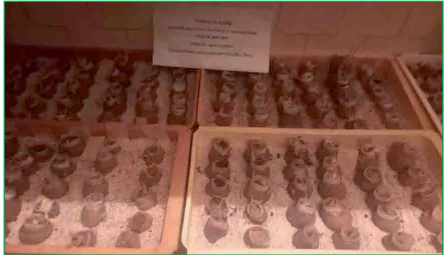
Рис. 5. Результати випробування сортів картоплі при ураженні літніми зооспорами звичайного патотипу збудника раку Synchytrium endobioticum Schilbersky Percival

1, 2, 3, 4 — зразки картоплі; K — контрольний сорт Поліська рожева