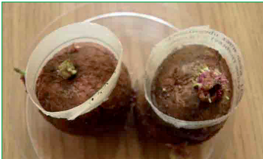
Рис. 7. Контрольний сорт картоплі Поліська рожева, уражений літніми зооспорами звичайного патотипу збудника раку Synchytrium endobioticum (Schilb.) Perc.

вах з п'яти зразків один отримав оцінку стійкого (20,0%). Це сорт Акустик — селекції фірми Сі. Маєр Бі. Ві. (Великобританія) (табл.). Сорти картоплі Міа, Сенсейшн, Балтік Файер та Леді Амарілла отримали оцінку сприйнятливих до даного патотипу збудника раку.