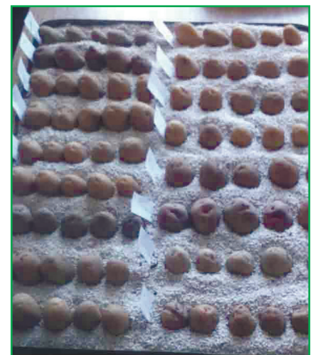
Рис. 1. Закладання лабораторних дослідів з оцінки та відбору сортів картоплі, стійких проти раку у субстраті ґрунт/перліт з використанням зимових зооспор Synchytrium endobioticum (Schilb.) Perc.

Zarazhennya zrazkyv kartopli zoosporami iz zymuyuchykh zoosporan'iv zbudnyka raku provodили v laboratornykh umovakh u spetsyalnykh konteynerakh (30 × 40 см) iz substratom grunt/perlit (1:1), yakyy vmishchuvav 50—60 zymovykh zoosporan'iv zbudnyka khvoroby na 1 г ґрунту. Dlya tьogo v konteynerakh vysadzhували zrazky kartopli dlya vyprovuvannya та kontrolynykh sorti: pozytyvnyy kontroly — сорт, yakyy urazhuється zbudnykom raku (Polіsьka rozeva, Lorx) та negatyvnyy kontroly — сорти, sho ne urazhuayutsya zhdnym patotypom zbudnyka raku (Bozhedar, Glazurna) (rys. 1). Konteynery zalыshalı u laboratorii na 75 dіb za 60—80-vidsotkovoy vologosti, osvіtlennya — 1600 lyuks 12/12, za temperatury 17—18°C. Cherez kozhnykh try doby іx polыvalы, raz na tyzhdenь zdіysnyvalы rozpushuvannya i cherez 75 dіb vyznachalı reaktsiyu zrazkyv kartopli na zarazhennya zbudnykom raku. Dlya tьogo roslыny pidkopували z konteyneriv i pidrahovували rakovy narosty z kozhnogo doslydnoho zrazka, a також z kontrolynykh sortiv kartopli. Rezulytaty vvažalı dostovіrnyми, yaksho urazhennya pozytyvnoho kontrolynoho sortu stanovыlo ne menше 80% [22].