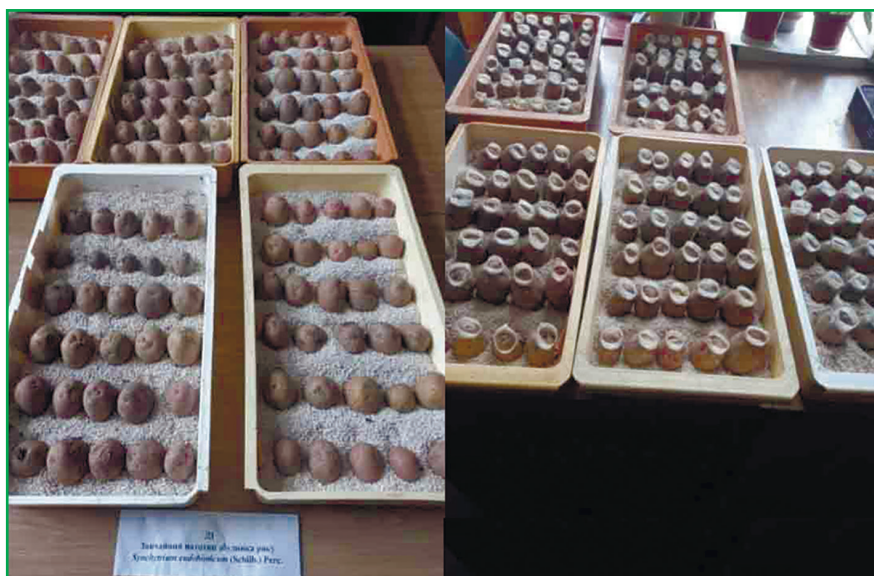
Рис. 2. Підготовка зразків картоплі для зараження зооспорами зі свіжих ракових наростів Synchytrium endobioticum (Schilb.) Perc.

Оцінку на стійкість проти раку у польових умовах здійснювали на природному інфекційному фоні у вогнищах розповсюдження патогену звичайного ( D 1 ) патотипу в населеному пункті Берегомет Вишницького р-ну Чернівецької обл.; до агресивних патотипів — у н. п. Майдан Міжгірського р-ну (11 патотип), в м. Рахів (13 патотип), с. Ясіня (18 патотип) Рахівського р-ну Закарпатської обл., і в н. п. Бистрець (22 патотип), Верховинського р-ну Івано-Франківської обл. Дослід закладали в триразовій повторності. В якості позитивного контролю використовували сприйнятливий до всіх патотипів раку картоплі сорт Поліська ро-