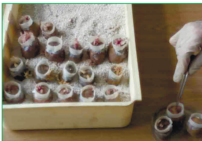
Рис. 3. Зараження зразків картоплі зооспорами зі свіжих ракових наростів Synchytrium endobioticum (Schilb.) Perc.