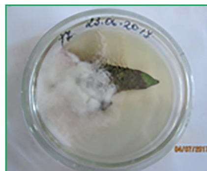
Рис. 3. Міцелії збудників Fusarium spp. на стерильному середовищі (сорт Опал, оригінальне фото)