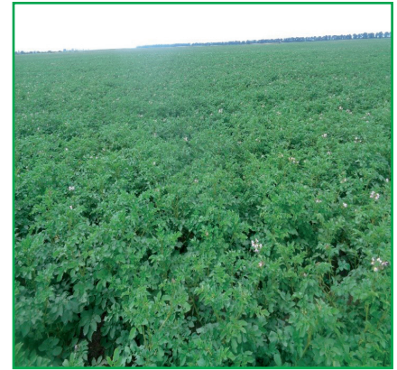
Рис.1. Виробнича посадка картоплі у ФГ «Габенець», сорт Опал, 2018 р. (оригінальне фото)

За період дослідження у ФГ «Габенець» вирощували сорти картоплі: Фантазія, Піроль, Карлена — у 2017 р.; Опал, Кібіц, Піроль — у 2018—2019 рр.