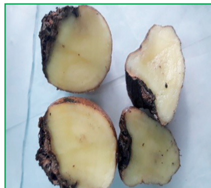
Рис. 2. Вигляд бульби картоплі сорт Опал у розрізі — ураження сухою фузаріозною гниллю, (оригінальне фото)

Під час оцінювання стійкості встановлено, що сорт Піроль на виробничих посівах та у конт-