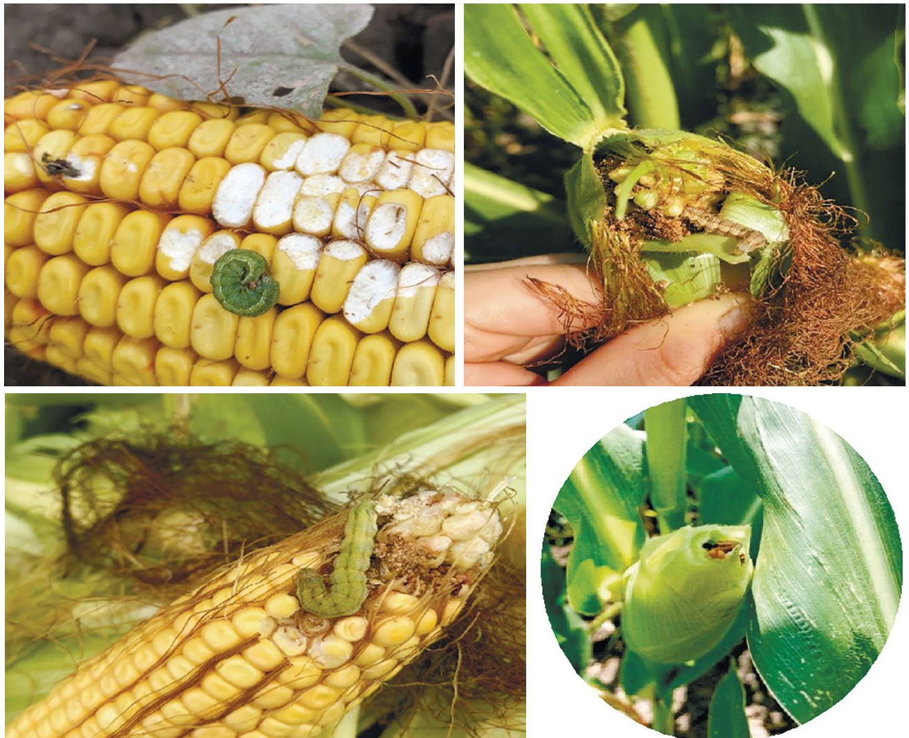
Рис. 2. Гусениці бавовникової совки на качанах кукурудзи

Обробляли посіви кукурудзи інсектицидами та здійснювали обліки відповідно до регламентів Методики випробування і застосування пестицидів [9].