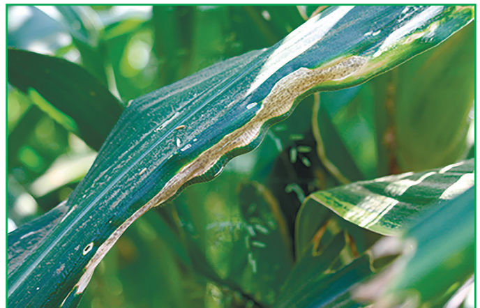
Рис. 2. Гельмінтоспоріоз кукурудзи