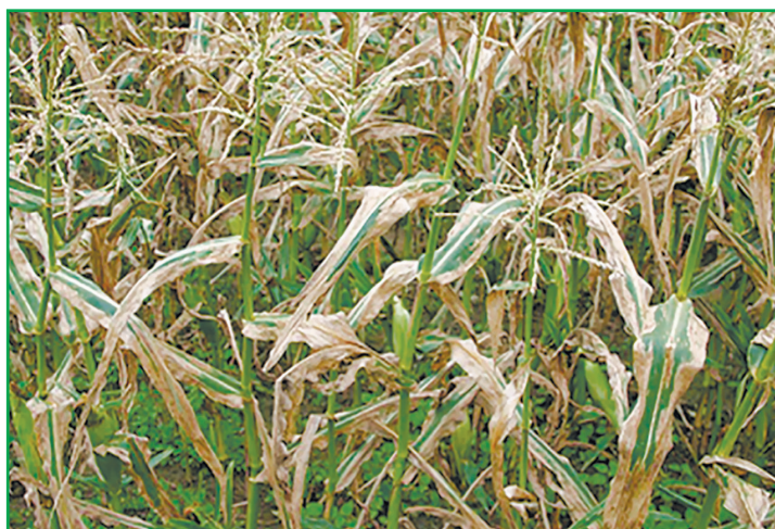
Рис. 3. Гелмінтоспоріоз кукурудзи

Попередник — озимі зернові. Після збору попередника провели дискування на 10–12 см. Оранка — на 26–28 см. Підзяблеву оранку вносили мінеральні добрива в нормі Р 60 К 100 . Навесні провели закриття вологи, передпосівну культивуацію та внесення азотних добрив — N 120 . Гібрид — LG 3258 (ФАО 250). Захист від бур'янів включав внесення гербіцидів Примекстра TZ Голд 500, SC (д.р. S-метолахлор, 312,5 г/л + тербутилазин, 187,5 г/л) — 4,0 л/га та МайсТер 62, в.г. (форамсульфурон, 300 г/кг + йодосульфу-