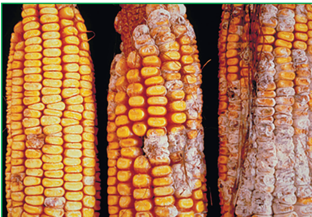
Рис. 1. Фузаріоз качанів кукурудзи

Найбільш поширеними та шкідливими хворобами кукурудзи в умовах України є пухирчаста та летюча сажки, гельмінтоспоріоз, фузаріоз, іржа. Залежно від зони вирощування кукурудзи