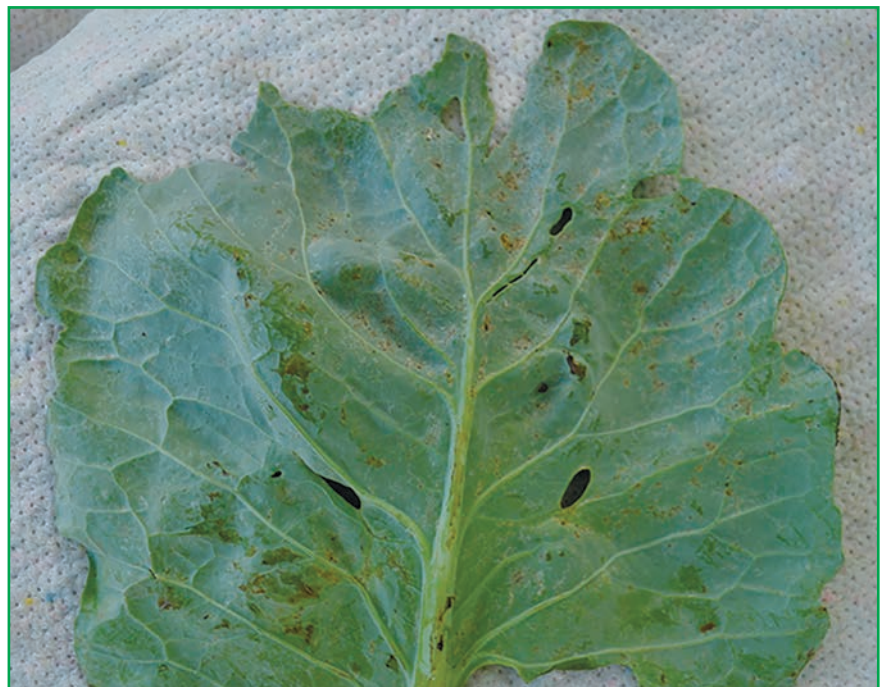
Рис. 2. пошкодження листя капусти тютюновим трипсом